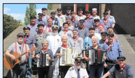
Shantykoor De Admiraliteit

https://shantykoordeadmiraliteit.nl/ https://shantykoordeadmiraliteit.nl/fotos-2022/