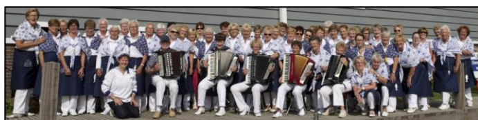
Viswijvenkoor De Vliet Grieten

https://sskstuurloos.nl/finale-battle-of-the-shantys/