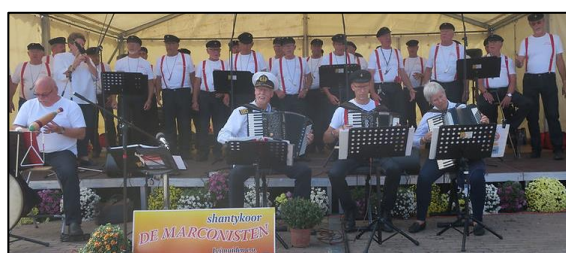
Shantykoor De Marconisten

https://www.flickr.com/photos/130317795@N02/sets/72177720304389626/