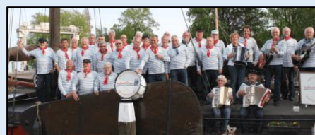
Shantykoor De Moordtzangers