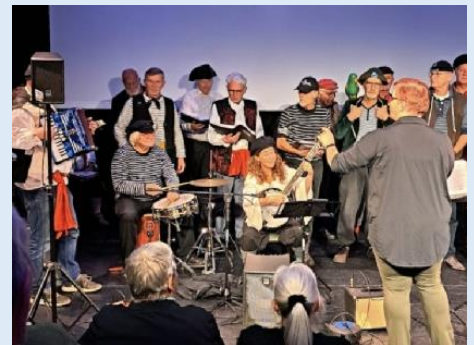
De Kamper Koggezangers