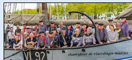
De Vlaardingse Maatjes

https://www.devlaardingsemaatjes.nl/ https://www.devlaardingsemaatjes.nl/5-november-22/